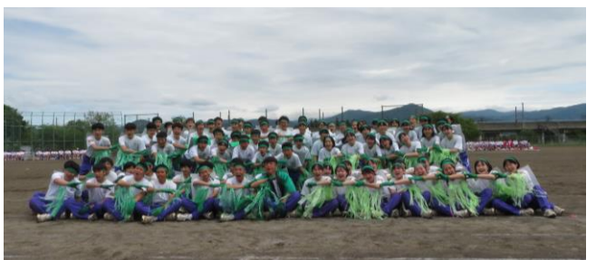
青組～「青々堂々」な「青狼」軍～