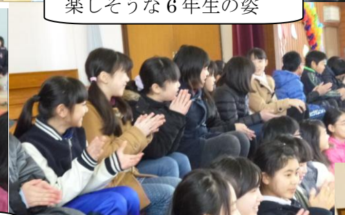
エールを送ります。