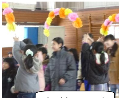
はっけよい、のこった

3 学期も残すところわずかとなってきています。体調に気を付けて、残りの学習をがんばらせたいと思います。