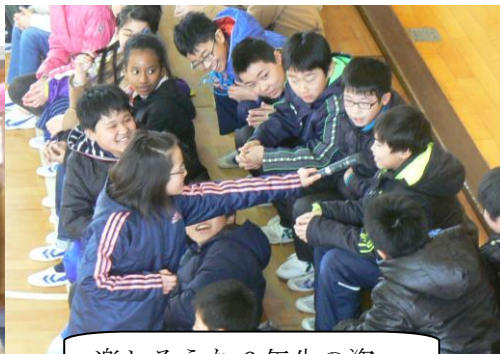
楽しそうな 6 年生の姿