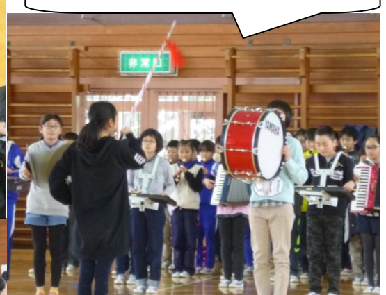
6 年生の前で見事な演奏をする 4, 5 年生