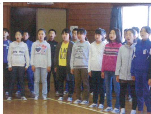
全校合唱練習風景より

また、当日は皆様お誘い合わせの上ご来校いただき、子ども達を励ましていただければ幸いです。寒くないような服装でおいでいただきたいと思います。心よりお待ちしております。