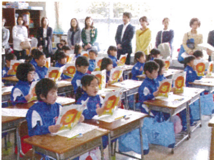
元気に「あいうえお」を読む1年生（国語）

今後とも学校・保護者・地域が一体となって子ども達の健やかな成長のために頑張っていきたいと思っております。ご支援・ご協力をお願いいたします。