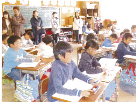
真剣に先生の話聞く3年生（算数）