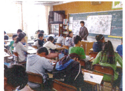
資料から分かることを一生懸命さがす6年生（社会）