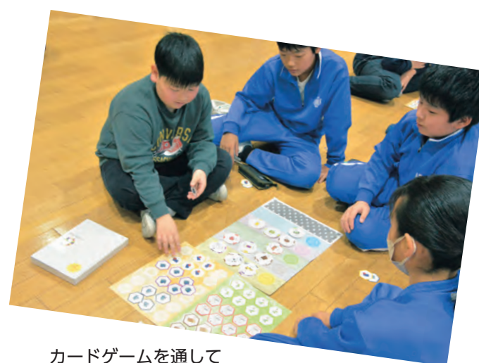
カードゲームを通して SDGsについて学ぶ児童

田園ホール恒例の町内園児によるツリー飾り付けと展示は12月24日まで、同ホールロビーで行われました。町内各園の年長児208人の手作りオーナメントがクリスマスの雰囲気を出しました。 12月5日は、やはばこども園の16人が飾り付けを行いました。