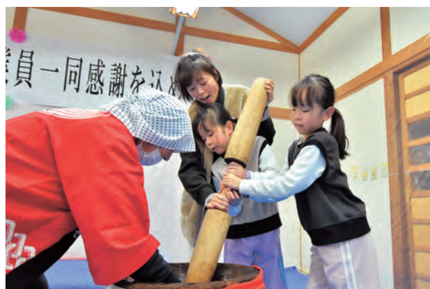
岩清水右京の会の会員(左)と 餅つきを体験する来館者

保養センター リニューアル10周年 平成25年8月9日の豪雨災害で甚大な被害を受けた煙山の町国民保養センターで12月3日、リニューアル10周年を記念したイベントを実施。町内外から約380人が来館し、入浴後の抽選会や餅のふるまひなどの催しを楽しみました。 また、来館者にヒマワリの種をプレゼントしました。