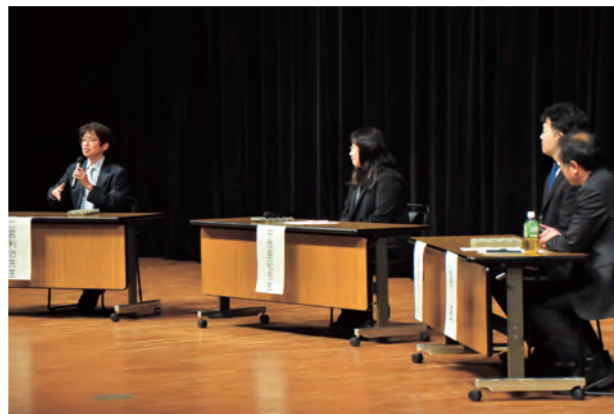
有識者により行われたパネルディスカッション