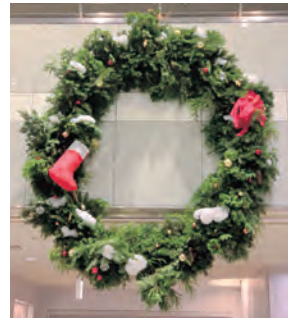
町公民館に設置している 巨大リース

の豚汁は、3ちゃん矢次工 房のみそをベースにショ ウガを効かせて、町産の原 木シイタケや野菜、とくだ やの凍み豆腐など、「矢巾」 を詰め込んで作りました。 マーケットで出会った町 の美味しい食材、植物の活 用、作り手さんとの会話、 いかがでしたか？