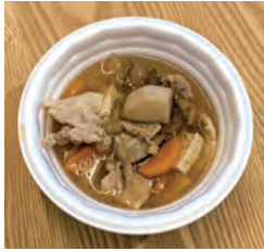
お振る舞いの豚汁