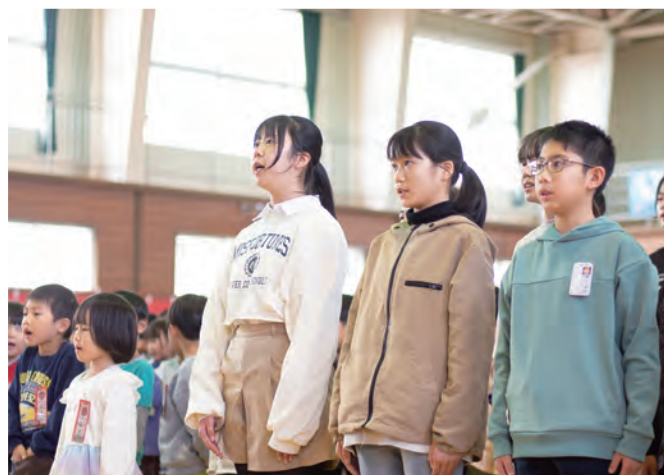
喜びの言葉の発表を行う 煙山小の児童たち

「今までも、そしてこれからも、私たちのことを見守ってください」など、学校に関わってきた地域住民などへの感謝や、これからの学校に対する思いなどを述べました。 また、全国屈指の実力を誇る同校吹奏楽部による記念コンサートも開催。振り付けを交えた力強い演奏で150年の節目に花を添えました。 同校は明治7（1874）年に開校し、これまでに約1万2千人が卒業しました。