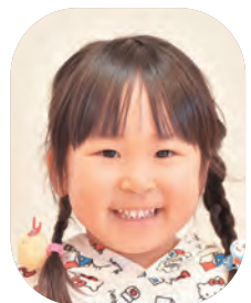
しらたののちゃん