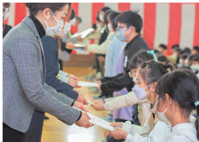
保護者から児童へ 記念品をプレゼント

※広報紙に掲載した写真を提供し ています。希望する方は企画財政 課へ問い合わせください。