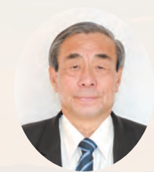
矢巾町長 高橋 昌造