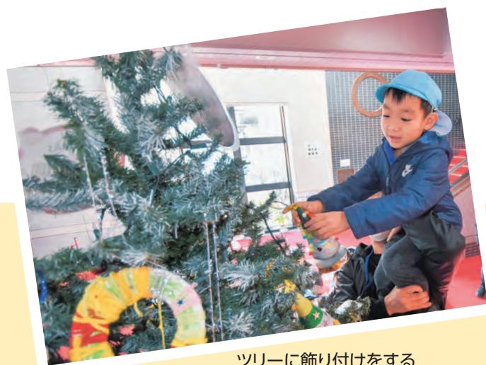
ツリーに飾り付けをする やはばこども園の園児

保養センター リニューアル10周年 平成25年8月9日の豪雨災害で甚大な被害を受けた煙山の町国民保養センターで12月3日、リニューアル10周年を記念したイベントを実施。町内外から約380人が来館し、入浴後の抽選会や餅のふるまひなどの催しを楽しみました。 また、来館者にヒマワリの種をプレゼントしました。