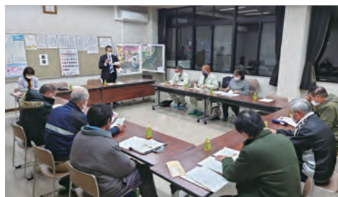
1月18日に開催した説明会の様子

法律が改正され、市町村では令和7年3月末までに「地域計画」を策定することとなりました。これは、町内各地域で将来の農地利用を話し合って作った計画「人・農地プラン」に、10年後の農地利用の姿を示した『目標地図』をプラスしたものです。現在は地域内ではばらばらに耕作されている農地を、耕作者ごとにまとめる*ことで効率的な農業に取り組むための将来像を、地図に表します。