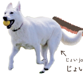
じょい joy マスコット犬 じょいワン・クレアさん