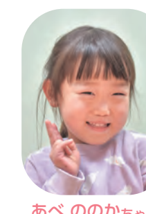
あべののかちゃん