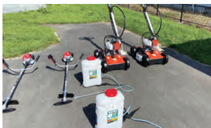
広宮沢1区自治会で購入した草刈り機械など

この助成事業は宝くじの社会貢献広報事業として、宝くじの受託事業収入を財源として実施しているコミュニティ助成事業です。