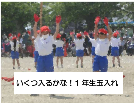
いくつ入るかな！1年生玉入れ

晴天に恵まれた今年度運動会。終息の兆しが見えないコロナウィルス感染症と闘いながらの実施でしたが、全校児童が一堂に会し運動することができました。また、保護者の皆様の温かい声援に励まされ、練習以上の力を発揮することができました。競技を終えた子ども達は、心地よい疲労感とやり遂げた満足感で一杯です。様々な制限に不平不満をもらさず、係活動や競技にしっかり全力で取り組んだ子ども達に拍手を送りたいと思います。