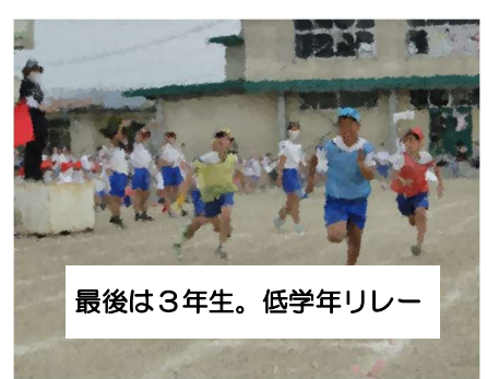
最後は3年生。低学年リレー