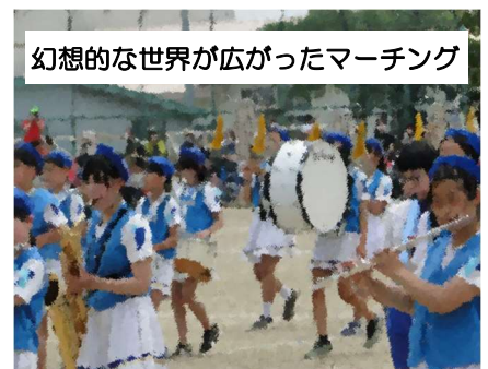
幻想的な世界が広がったマーチング