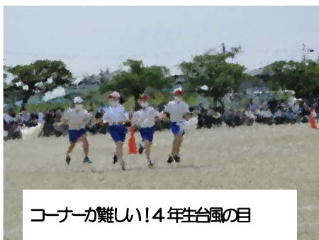
コーナーが難しい！4年生台風の目