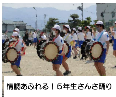
情調あふれる！5年生さんさ踊り