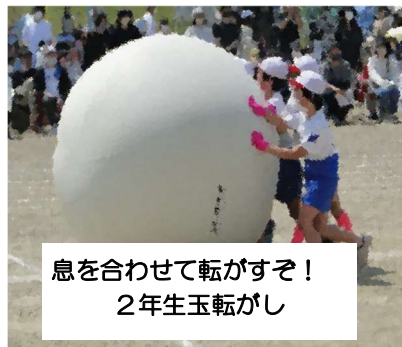
息を合わせて転がすぞ！ 2年生玉転がし