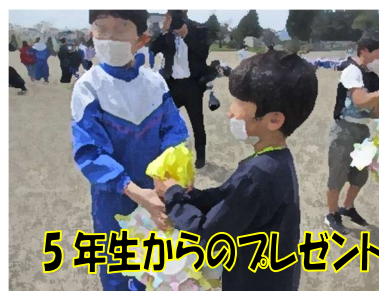
5年生からのプレゼント