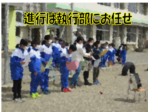
進行は執行部にお任せ