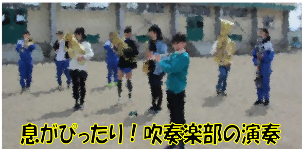
息がぴったり！吹奏楽部の演奏

2年生から6年生までみんなで、1年生の入学を心から喜び、精一杯おもてなしをしました。最初、何が始まるかとザワザワしていた1年生も、会が始まると「し〜ん」と集中し、それぞれの学年の発表を見入っていました。楽しい一時を過ごしました。