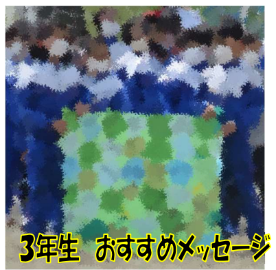
3年生 おすすめメッセージ