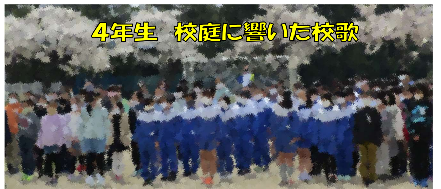
4年生 校庭に響いた校歌