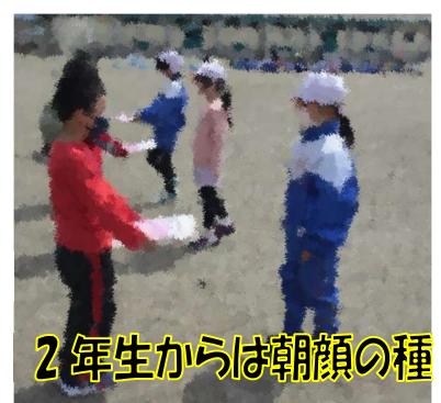
2年生からは朝顔の種