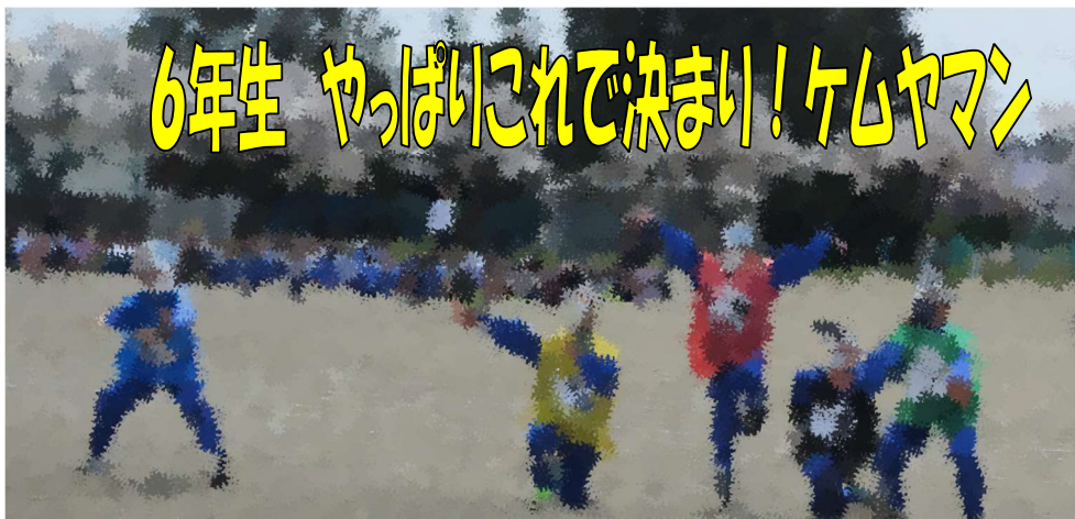
6年生 やっばいこれで決まり！ケムヤマン