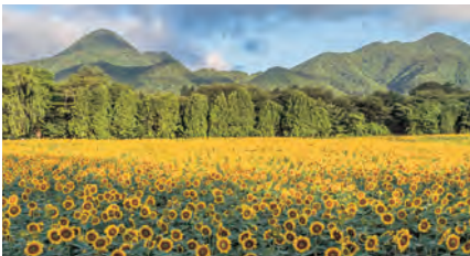
昨年の煙山ひまわりパークの様子