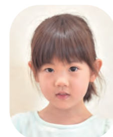
いなべ あおちゃん