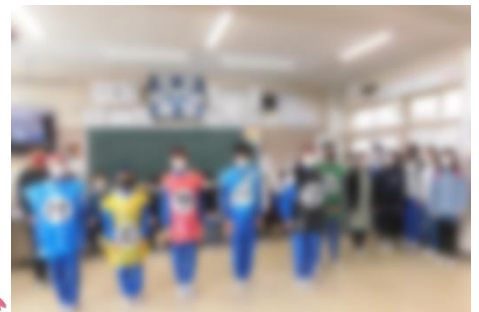
メはやっぱりけむやマン6年生