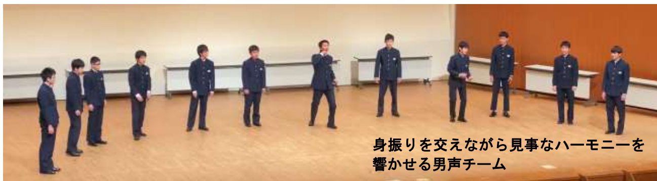
身振りを交えながら見事なハーモニーを響かせる男声チーム

1月30日(日)都南文化会館キャラホールで行われた第31回県合唱小アンサンブルコンテストにおいて、本校代表の3チーム全てが金賞を受賞しました。2年生を主体とした女声Aが全体1位となり、3月に福島市で行われる全国大会に推薦されました。また、1年生のみで編成した女声Bが3位、3年生4名を含む男声が6位と上位入賞を果たしました。3チーム全てが金賞というのは本校初の快挙であり、これまで3年生や卒業生によって積み上げられてきた本校合唱文化の賜物と考えます。感染症が蔓延する中、対策を講じながら練習に励んできた生徒達の努力が報われたことをうれしく思うとともに、県の代表となった女声Aの皆さんには、次なるステージに向かって更に曲の精度を高めていってほしいと思います。