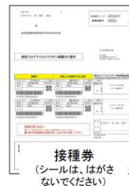
接種券 (シールは、はがさ ないでください)