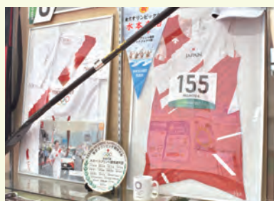
町民総合体育館に 展示中の記念品