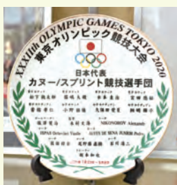
カヌースプリント 選手団全員の 名前が入った 記念皿

昨年まで役場1階町民ホールに展示していたもので、オリンピックで実際に使ったユニフォームやパドル、ゼッケンなど、貴重な品々が並んでいます。体育館にお越しの際は、ぜひご覧ください。