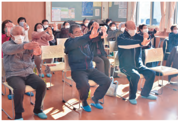
岩手ビッグブルズの選手やチアの指導のもと、体を動かす参加者ら

任期最終日となった14日は職員から花束を送った他、役場1階町民ホールで多くの職員が見送りました。