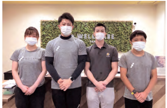
令和4年のご利用も スタッフ一同、お待ちしております！

■町地域おこし協力隊に関する問い合わせ 役場企画財政課企画コミュニティ係（☎611-2721）