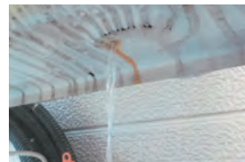
設置から10年以上経過したホームタンクで、内部に水が溜まって穴が空き灯油が流出した事例