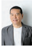
ゲスト 千昌夫さん