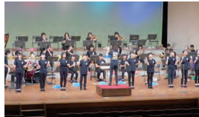
昨年の音楽祭の様子