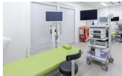
胃内視鏡検査で使われる検査室

4月にオープンする「すこや館」は、県民の健康増進を目的とする岩手県対がん協会の「健診専門施設」です。健診は1日ドック・特定健診などの総合健診の他、胃内視鏡検査、各種がん検診ができます。岩手医科大学附属病院の敷地内に立地しており、同病院への紹介など医療連携も図られます。