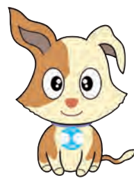
行政相談マスコット キクーン