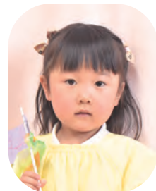
あらしき かのちゃん