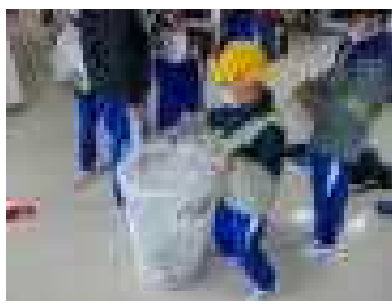
ペットボトルキャップ回収

5月11日(月) JRC委員会によるボランティア活動が行われました。今年度は、次のような活動を計画しています。また、「ちょこっとボランティア活動」(ちょボラ)にも取り組んでいきます。子どもたちへの応援とご協力をお願いします。