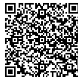
マイナポータル QRコード