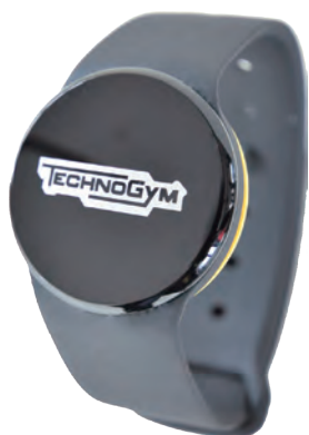
ウェルネスバンド

この他、体組成計で体脂肪率や筋肉量なども測定できます。町の新しいジムで、理想のカラダを目指しましょう！