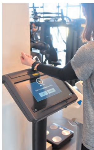
▼専用の機械にウェルネスバンドをかざして、運動履歴を確認できます。