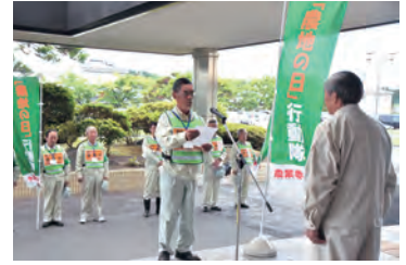
7月22日に行われた農地パトロールの出発式

町農業委員会では、毎年7月～9月を「農地パトロール月間」として取り組んでいます。農地パトロールは、遊休農地や農地の違反転用などについて調査します。農地の有効利用の促進などが目的です。