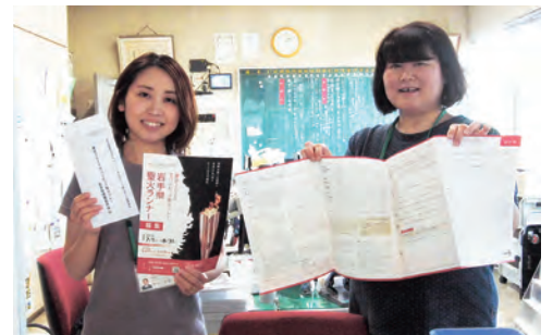
ランナーの応募を呼び掛ける町体育協会の職員ら

東京2020オリンピック聖火リレー岩手県準備委員会では、県内を走る聖火リレーランナーを募集しています。東京オリンピック開催の記念に、ぜひ応募してみませんか。