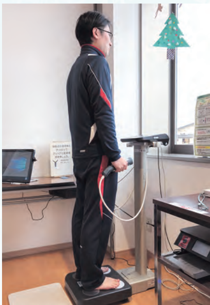
やはば一くに設置した機器で測定するとからだの状態を確認できます

町が指定するイベントへの参加、歩数などに応じてポイント付与し、獲得ポイントに応じて、町の特産品などが抽選で当たります。