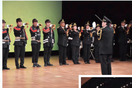
矢巾と紫波のラップ隊による合同吹奏(写真上)、盛岡市消防団がはしご乗りを披露(写真右)

消防組織法は、日本の消防の任務範囲、市町村が消防責任を負うなど消防に関する基本法を定めています。