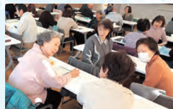
グループワークは、目標の達成状況をみんなと振り返ります

3月6日には、平成30年度の健チャレの活動を振り返るセミナーを開催。85の方が1年間の自分のからだの状態を確認するなどしました。