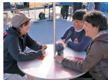
11月6日に放送した「やはばラジ」協力隊コーナーの公開収録の様子

私は人の笑顔を見るのが昔から好きです。笑顔は必ず伝染します。この1年たくさんの笑顔に囲まれてとても幸せでした。協力隊の任期は3年で、私に残された時間は2年。空回りして気づいたら任期終了…なんてならないように、「誰のために、何のためにやるのか」を考えながら、皆さんの笑顔が増えていくことをしていきます。