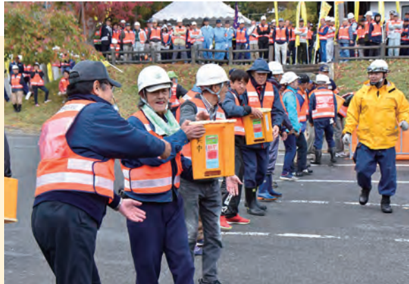
火元まで列をなして、水の入ったバケツを渡す 自主防災会の皆さん

町では10月28日、「町総合防災訓練」を矢巾温泉郷周辺で実施。地域住民と町消防団ら約300人が参加し、延焼防止や初期消火、救急救護の訓練などを行い、防災意識の高揚を図りました。