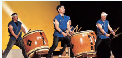
演技を披露する氷上共鳴館の皆さん

このほか、アトラクションとして陸前高田市の氷上共鳴館氷上太鼓、紫波町の佐比内金山太鼓の皆さんが、まちを明るく元気にする演技を披露しました。