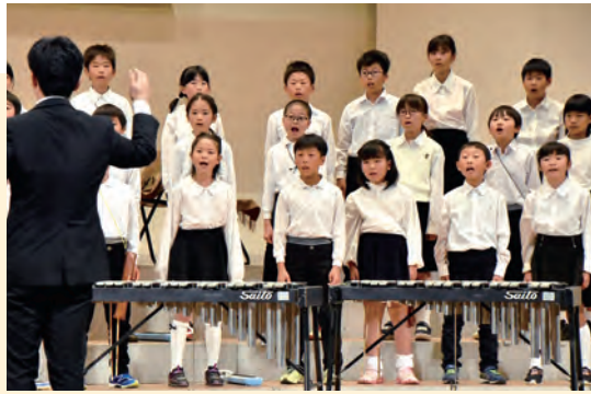
徳田小学校の3、4年生が「怪獣のバラード」ほか2曲を披露

11月17日に町公民館で記念式典を開催し、関係者ら約100人が参列。式典の前には服装など点検する特別点検が行われました。