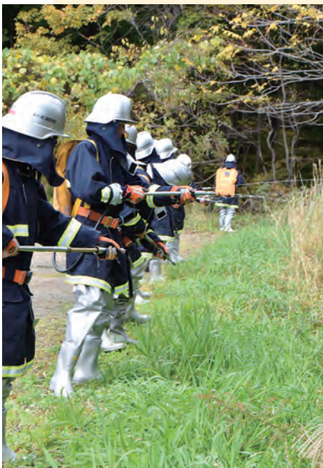
町消防団が延焼防止訓練を実施中

訓練は南昌山麓での「山火事」を想定して実施。町は被害状況を確認のため、ドローンを使用して上空を偵察。町消防団はハンドポンプと水をためるバッグが一体となった「ジェットシューター」で延焼防止訓練、自主防災会はバケツリレーで初期消火訓練を行いました。その他に、炊き出し訓練や煙体験、救急救護などの訓練が行われました。