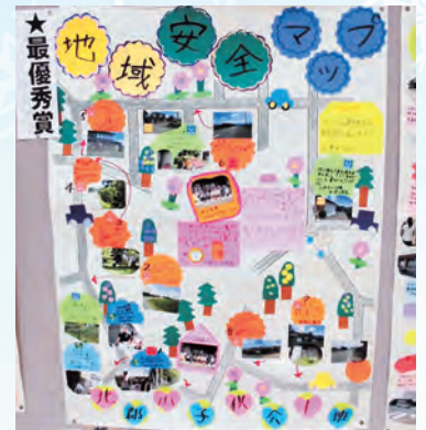
北郡山子ども会1班が作ったマップ