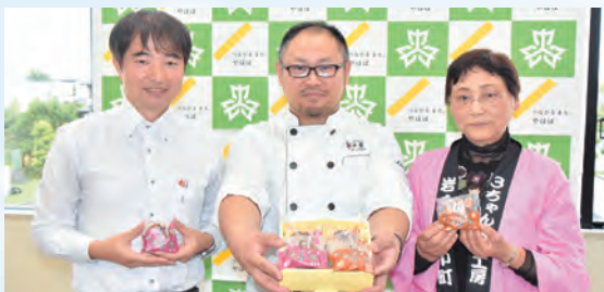
左から浅沼社長、似内専務取締役、中川副会長