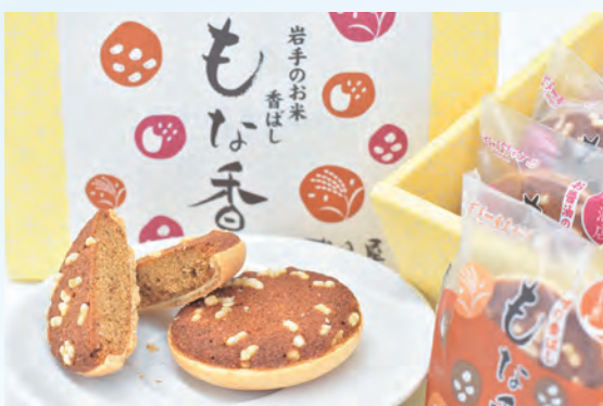
完成発表した「もな香」

砂田屋と3ちゃん矢次工房、浅沼醤油は減塩みそともろみを粉末にして作った焼き菓子の商品開発に取り組み、10月9日役場で「岩手のお米香ばし もな香」の商品発表会を開きました。