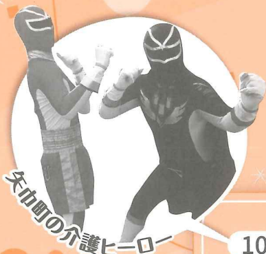
矢巾町の介護ヒーロー