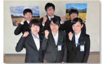
平成30年度採用の職員