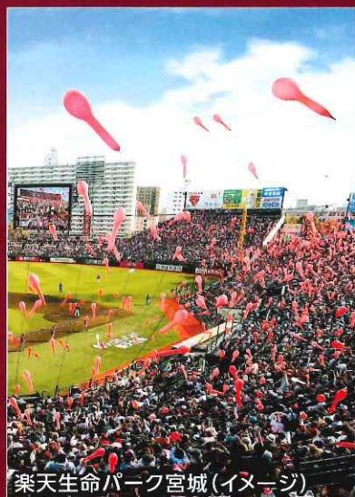
楽天生命パーク宮城(イメージ)