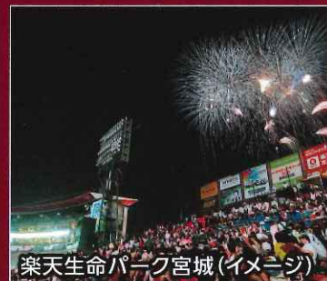
楽天生命パーク宮城(イメージ)

※雨天中止の場合、チケット代(2,000円)のみ返金となります。 ※3歳以下、及び未成年者の単独申込は不可。保護者同伴でお申込みください。