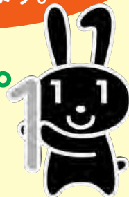
マイナンバーキャラクター「マイナちゃん」