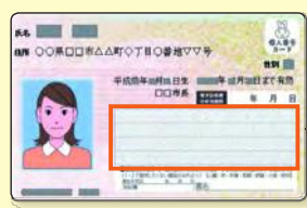
マイナンバーカード表面

転入届を出した場合でも、マイナンバーカードの住所変更手続きを行うことなく90日を経過すると、そのマイナンバーカードは失効となります。