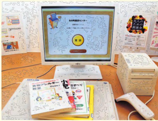
貸出手続きはこれで完了！