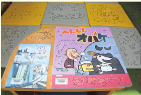
左は普通の絵本、右は大型絵本