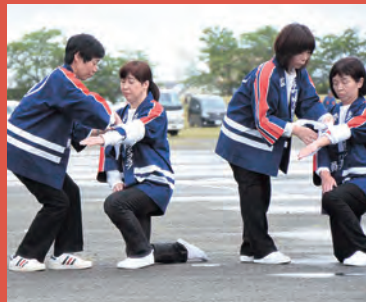
婦人防火クラブによる三角巾を利用した迅速な応急処置訓練