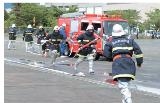
出動した町消防団による中継送水