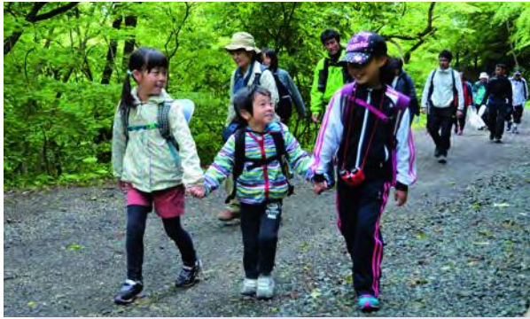
新緑を満喫しながら山頂を目指す参加者