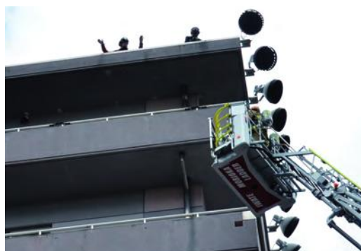
はしご車が屋上に逃げ遅れた人を救出