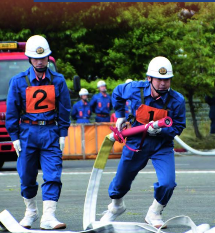
機敏で正確な動きを披露した操法訓練