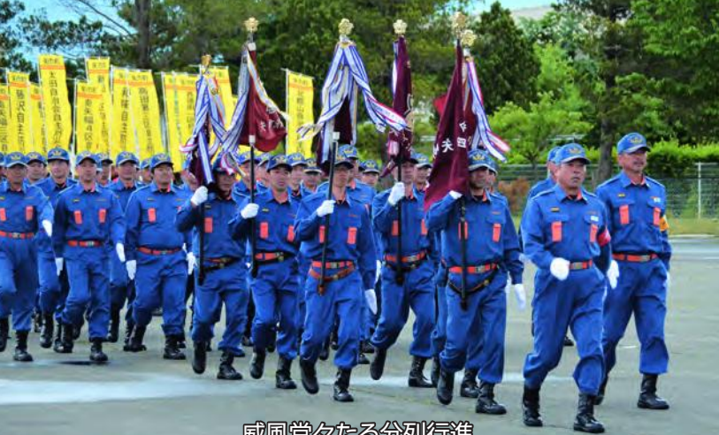
威風堂々たる分列行進