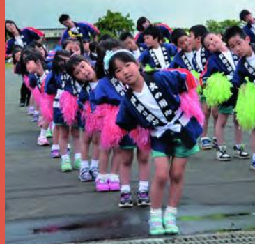
幼年消防クラブによる防火演技「つながれワッショイ」

入団希望の方や詳しい内容が知りたい方は、お近くの消防団員、または役場総務課防災安全室（☎611-2708）までお気軽にご連絡ください。