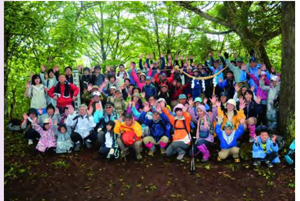
50回目の山開きを記念して山頂で記念撮影をしました

身の回りに起きた出来事など、 楽しい情報をお寄せください。 役場企画財政課 (☎ 611-2724)