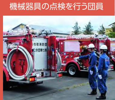
機械器具の点検を行う団員