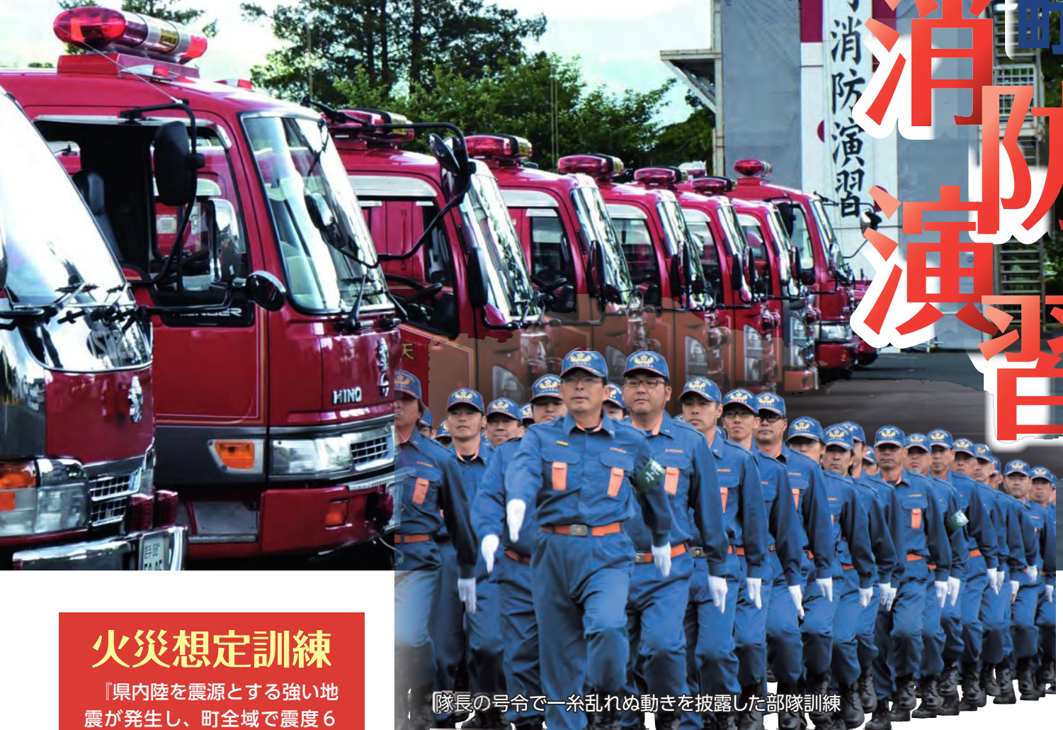
隊長の号令で一糸乱れぬ動きを披露した部隊訓練