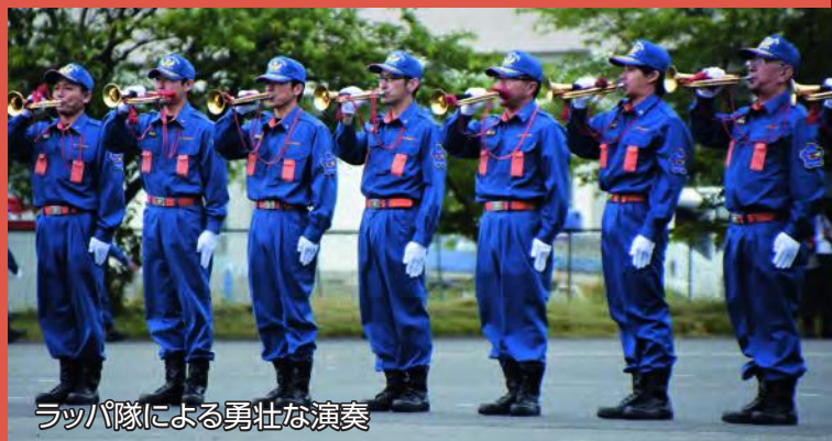
ラッパ隊による勇壮な演奏