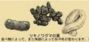
ツキノワグマの糞 食べ物によって、また体調によって形や色が変わります。)