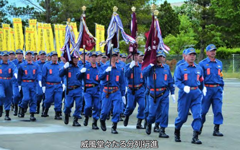
威風堂々たる分列行進