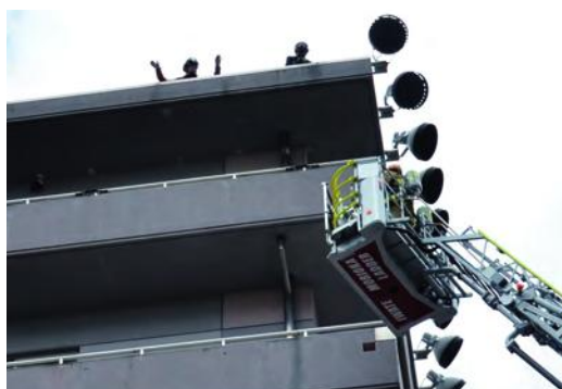
はしご車が屋上に逃げ遅れた人を救出