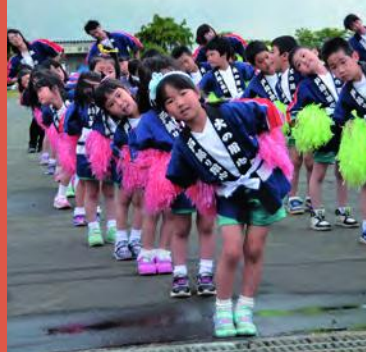
幼年消防クラブによる防火演技「つながれワッショイ」

入団希望の方や詳しい内容が知りたい方は、お近くの消防団員、または役場総務課防災安全室（☎611-2708）までお気軽にご連絡ください。