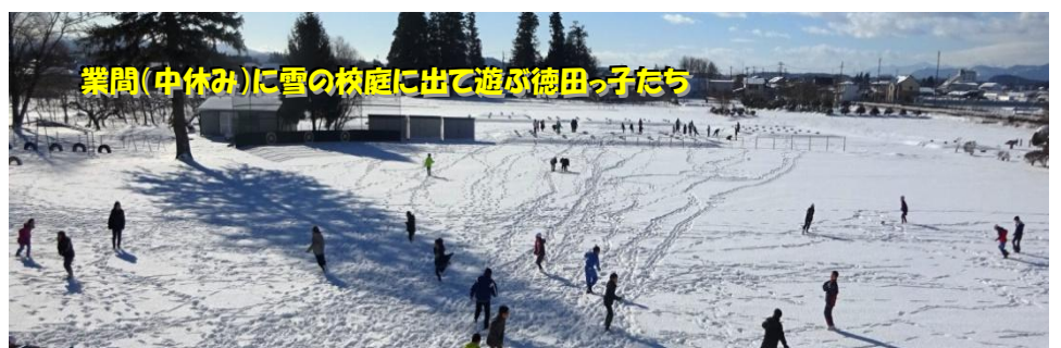
業間(中休み)に雪の校庭に出て遊ぶ徳田っ子たち