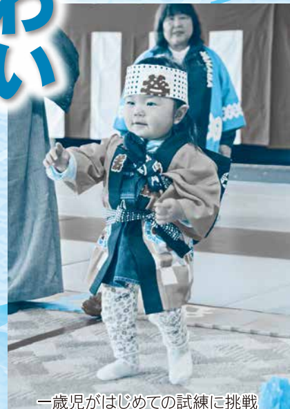
一歳児がはじめての試練に挑戦「一升餅歩行大会」