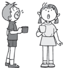
外出後は、 うがいを忘れずに！