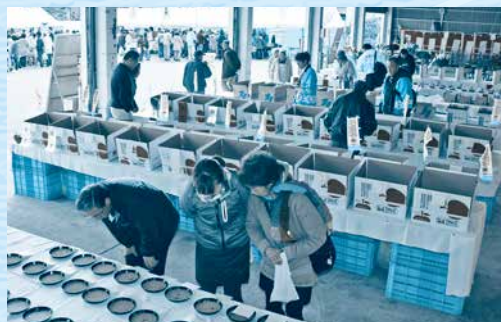
自慢の野菜や果物が並んだ農産物品評会