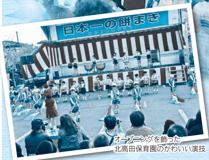
オープニングを飾った北高田保育園のかわいい演技