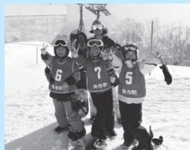
今年の冬はスキー・スノーボードにチャレンジ！

▶申し込み・問い合わせ 12月6日(火) から12月16日(金) までの開館時間内に、参加料を添えて町民総合体育館（☎ 697-4646）へお申し込みください。