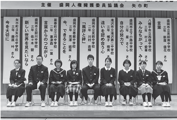
登壇して人権についての意見を発表した9人の中学生

中学生による人権尊重に関する意見発表会（盛岡人権擁護委員協議会・矢巾町主催）が10月31日、矢巾北中学校で開催されました。発表会には、同校の全校生徒と関係者ら約600人が来場。盛岡広域の9中学校から9人が登壇し、いじめのない学校づくりや、ボランティア活動や高齢者との交流で学んだことなどを発表し、命の尊さと人権の大切さを訴えました。参加した中学生は「互いの個性を認め合うことの大切さを改めて感じた」と理解を深めていました。