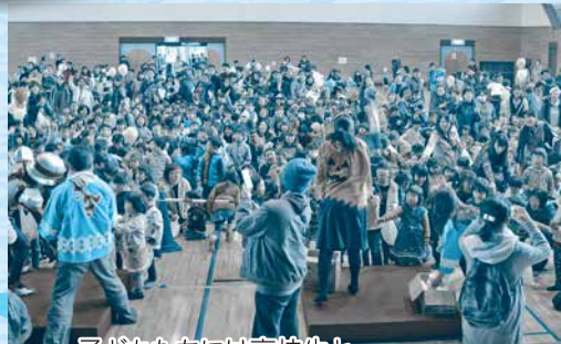
子どもたちには高校生とタケルンジャーが餅まきを行いました