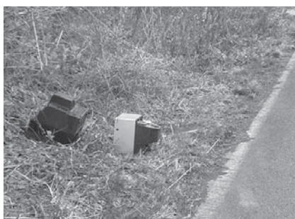
道路脇に投棄されたテレビ

平成27年度には、町内の不法投棄で警察に捜査を依頼したところ、不法投棄の原因者が判明。警察による取り調べの上、書類送検された事例がありました。