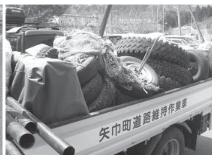
回収された大量の廃棄物