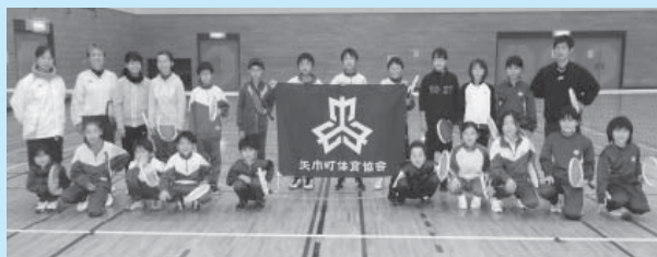
ソフトテニスの基礎を楽しく学ぼう！ (写真は平成27年の参加者)

▶申し込み・問い合わせ 所定の申込用紙に必要事項を記入の上、9月20日(火)から10月4日(火)までの、午前8時30分から午後5時までに(毎週月曜日は休館)、町民総合体育館へお申し込みください(申込用紙は町民総合体育館事務室で配布しているほか、矢巾町体育協会ホームページ( http://yahabataikyounet )でもダウンロードできます)。参加料は受講者決定後にお支払いください。