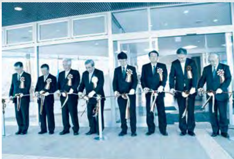
関係者がテープカットを行いました