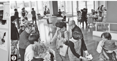
⑥バルーンアートがお出迎え⑦こずかた保育園児による元気いっぱいの踊り⑧昔の矢幅駅前写真を中心に展示した「矢巾町今昔写真展」⑨ラウンジでは手作りみそやスイーツも販売