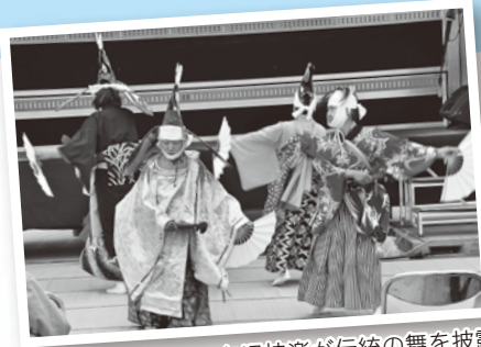
白沢神楽が伝統の舞を披露