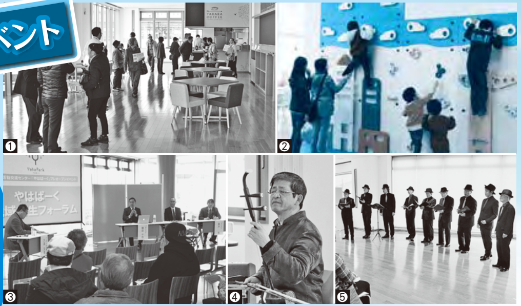
①広々とした1階ラウンジを見学②たくさんの遊具で子どもたちは大はしゃぎ③複合施設とまちづくりについて意見交換④⑤町内団体によるパフォーマンス

開館1週間前の3月27日に プレオープニングイベントとして 施設見学会と地方創生フォーラムを開催 し約550人が来館。1階から順に施設内を 見学し、利用方法などの説明を受けました。 フォーラムでは「複合施設と住民参加のまちづ くり」をテーマにシンポジウムを開催したほか、 やはばーくを練習成果を披露する場として活用 する例として、町内芸術文化団体によるパ フォーマンスステージも開催されました。