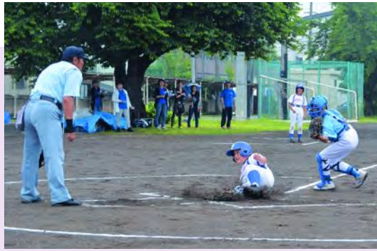
得点を狙い、ホームベースへ滑り込む選手(西徳田ブルーウィングス)

“社会を明るくする運動”矢巾推進委員会では7月3日、町内9カ所で啓発活動を実施。犯罪や非行のない明るい社会を実現するために、矢幅駅前まで通勤・通学をする方に呼びかけを行いました。