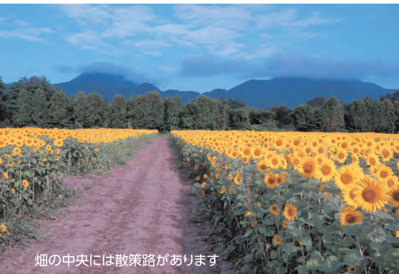
畑の中央には散策路があります