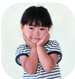
ふじわら きさちゃん

◆夜間急患診療所(午後7時～午後11時)盛岡市神明町 ☎654-1080 ◆高度救命救急センター 盛岡市内丸 ☎651-5111 (お願い) かせなどの軽い症状の場合、午後7時から午後11時までは夜間急患診療所をご利用ください。 ※土曜日は、病院により診療の有無や時間が異なりますので、直接各病院にお問い合わせください。