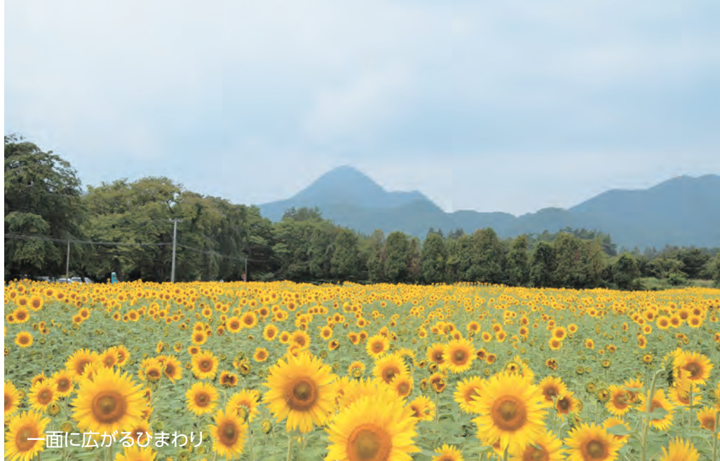
一面に広がるひまわり