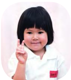
はれやまりんか ちゃん

瑞宝章6つのうちの1つの章。公的な職務の複雑度、困難度、責任の程度など評価し、受章者が決定する。