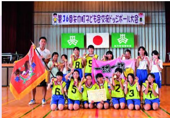
優勝した高田1区チームの皆さん