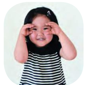
ほうじょうりのちゃん