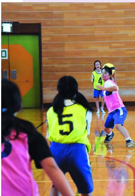
華麗なパスワークで相手を追い詰め、 攻撃する藤沢チーム

この大会は1982年に始まり、参加チームの減少で今年が最後の大会となり、長い歴史に幕が下りました。