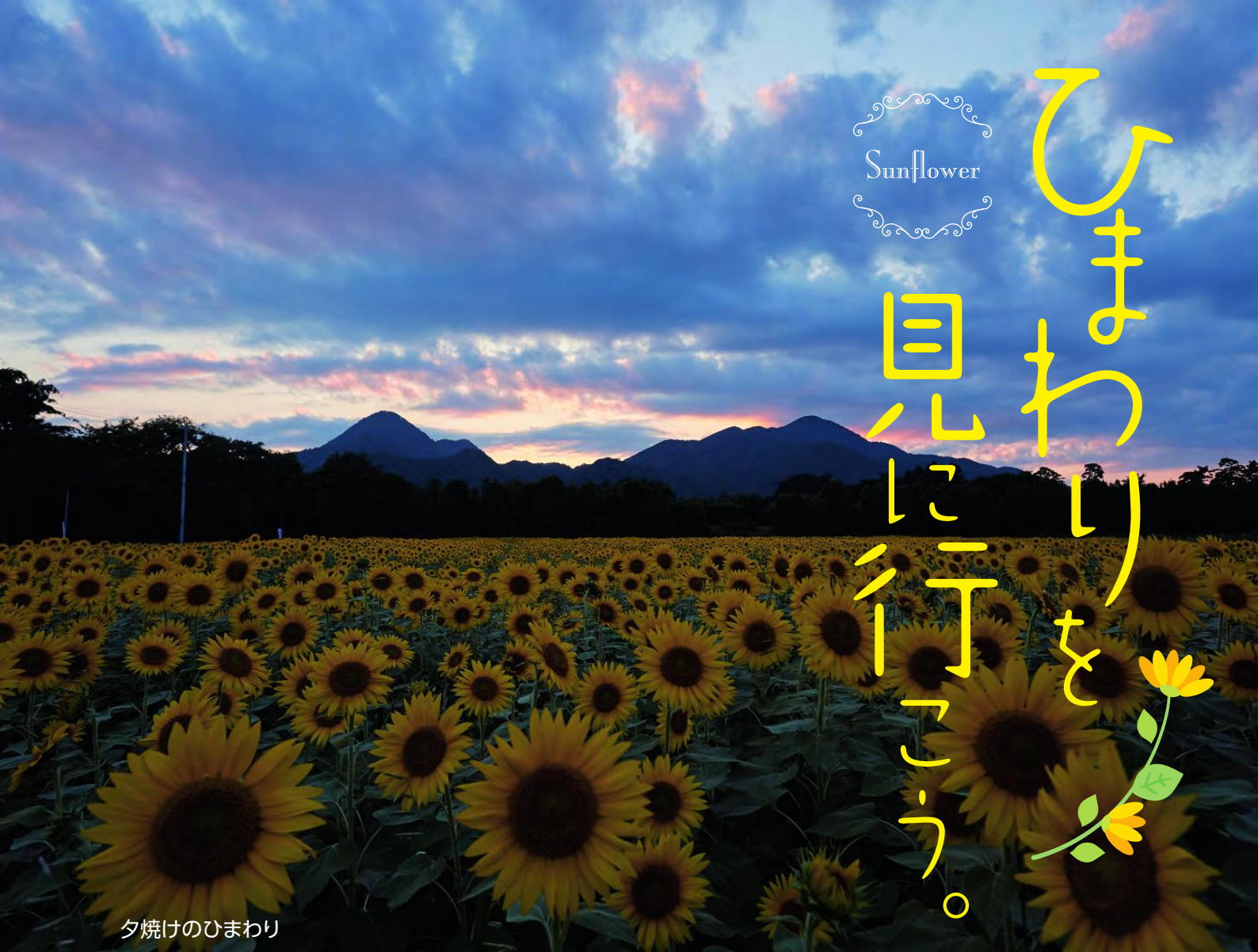
夕焼けのひまわり

「ひまわり畑」―未来への希望と明日からの活力を与える場所。町内外からたくさんの方が訪れる矢巾のひまわりを見に行きませんか。