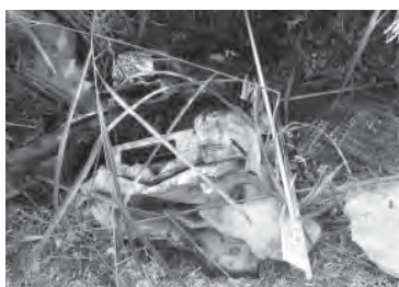
町内の不法投棄現場