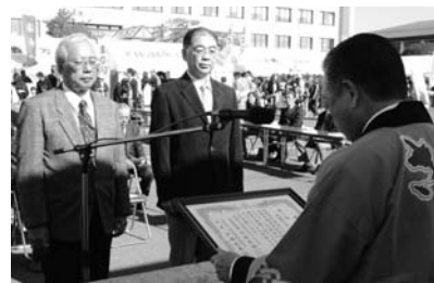
秋まつり会場で行われた表彰式

自治会対抗資源回収コンクール（矢巾町ごみ減量推進員協議会主催）の表彰式が 10 月 27 日、矢巾町秋まつり会場で行われました。今回の優勝は、1 人当たりの資源回収量が 34.7kg だった流通センターコミュニティとなりました。なお、上位の結果は下表のとおりです。