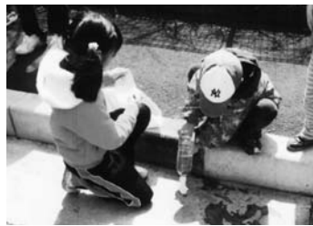
犬のフンを片付ける フンバスターズ活動の様子

流通センター子ども会では今年の4月8日、春の清掃活動の一つとして「フンバスターズ」を結成しました。22人の子どもたちが、雪が解けて目立ってきたフンを専用のビニール袋を使って拾い、水の