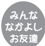
矢巾中央幼稚園 (3歳児)