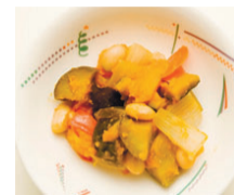
簡単に作れる「カボチャと大豆のラタトゥイユ」レシピ