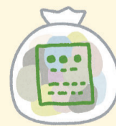
他自治体の指定ごみ袋