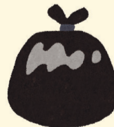
中身が見えない袋(黒色の袋など)