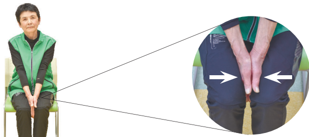
【参考】茨城県立健康プラザシルバーリハビリ体操指導士養成講習会テキスト