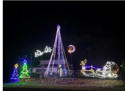
下北公民館イルミネーション